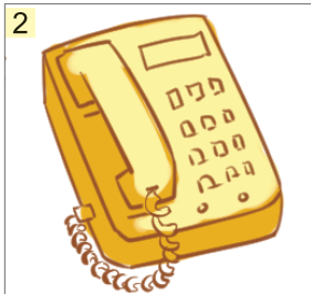
电话 ( )