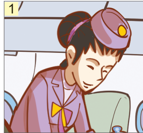
医生 ( )