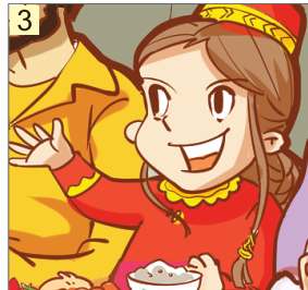
高兴 ( )