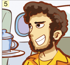
爸爸 ( )