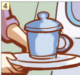
米饭 ( )